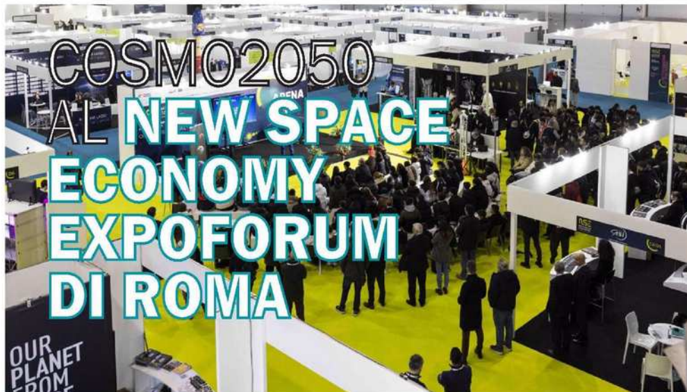
GLI STAND DELL'EDIZIONE 2024 DI NSE EXPOFORUM

A CURA DELLA REDAZIONE DI "COSMO2050", MENSILE DI ASTRONOMIA E SPAZIO